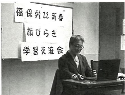
組合のない職場の傾向

また、組合がない職場では、勤務時間前超勤手当が「全くついていない」という回答が圧倒的に多い(88%)。データも出ましました。同じく、組合がない職場では、昼休憩が「ほとんどとれていない」と回答した比率も高く(42%)出ました。